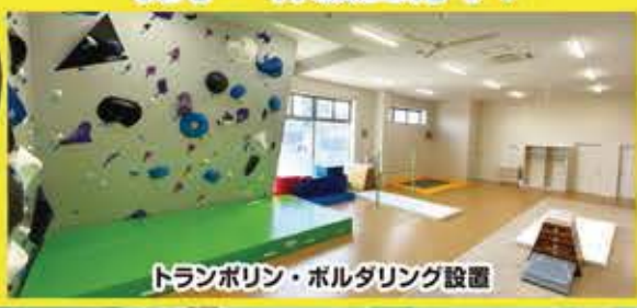
トランポリン・ホルダリング設置