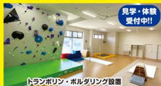
トランポリン・ボルダリング設置