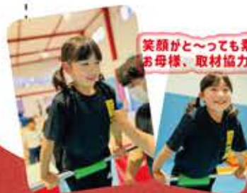
笑顔がと〜っても素敵なKちゃんとお母様、取材協力ありがとうございました!