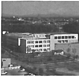
札幌市立屯田北小学校 外観

夢みる力をはぐくむ 本校は「夢みる力をはぐくむ学校」を基本方針とし、今年で開校9年目を迎えます。今年度は「夢みる力」を育てる「心のたがやし」「進んで運動」を重点目標として、学力、体力をバランスよく育んでいくように取り組んでいます。 具体的な活動としては、読書を習慣化するため、昨年度から朝読書の回数を増やしています。読書は子どもたちの心を豊かにし、夢みる力を育てます。また、子どもたちの健やかな身体を育てる具体的な取り組み