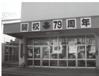
札幌市立幌北小学校