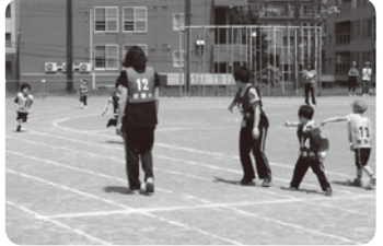
サタデースクール 「これであなたもアスリート」