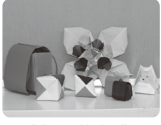
先生たちの折り紙の作品

のべ何人が跳べるかを競う「なわとびかっこ」とび王選手権」大会に出場し全国で4位に入賞しました。今年度はさらに上位を目指して一生懸命に練習しています。