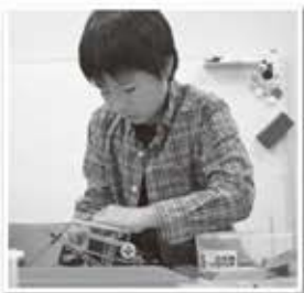
ベーシックコース

なおプログラミングコースはベーシック・ミドルコースで「考えるチカラと習慣」を養った後の開始で、開発現場の感覚としても、とても理にかなったカリキュラムです。 (P5右下の広告をご覧ください。)