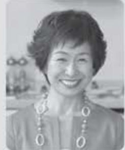
料理研究家 星澤 幸子

子どもを持たなくては一人前にはなれない、と親に言われたことがあります。まさしくその通りで十二分にかみしめさせて頂きました。でもまだ修業は続きます。祖母としての役目が更に増えて。