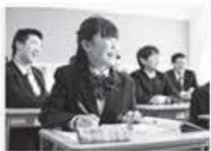
わかりやすく、手厚い指導

生徒が安心して勉強に取り始めるように、国語・数学・英語の授業で少人数の習熟度別授業を導入して教員が手厚く対応します。また個別の指導計画を作成して、本人と保護者と教員が学校生活の目標を共有しながら、学習効果の向上や生徒にあった進路の実現を図っています。