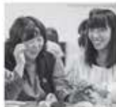
幅広い年齢層の学生が学んでいます。

保育士資格取得を目指す方にとって、「こども學舎」を選択する最大のメリットは午前授業であることです。一般的な専門学校とは異なり、市内の専門学校平均授業時間(約2,100時間)に比べて、「こども學舎」の授業時間は「1,125時間」と約半分です。そのため午後の時間を有効活用することができます。育児や保育現場でのアルバイト、本學で午後に開講する選択科目の履修のほか、PTA活動や熱中する趣味に打ち込むこともできます。保育現場でアルバイトをする学生が増えており、学生からは午前の学びと午後の保育勤務の実践とがリンクして、学びが深まるという声をよく聞きます。子育て中のママさん学生も多く、授業で保育の専門知識を学ぶことで、自分の子育てについて振り返り「もっと早く知りたかった…」と、話す学生が多くいます。