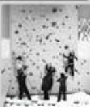
レイズ体操クラブ・ソレイユの森(4施設)の詳細情報はこちら