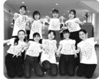
合唱練習、マスクをしながらの発声など、思うように練習ができませんでしたが、困難を乗り越えた団員たちは、心一つにして精一杯思いを込めて歌いました。いざはじまると、ステージ全体に緊張感が伝わり、小学生は真剣な眼差しで、先輩たちの歌声を注意深く聞きながら、夢中になって美しいハーモニを奏でます。

入団当初は緊張して声を出すことができなかった小学生も、中学生・高校生の歌声やハーモニを聞いてみると「かっこいい、先輩みたいに歌えるようになりたい」とあこがれをもち始めます。あこがれや目標とする人を見つけると、子どもはそこからぐんぐん成長していきます。先輩からの影響は技術なことだけでなく、