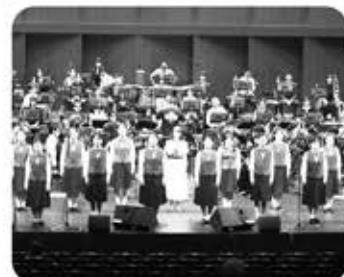
また、プロの舞台を仕切るプロフェッショナルな人たちの姿を見ることが大変勉強になります。衣装担当者、その人に合わせてその

場で衣装を縫ったり、照明の人、カメラの人のこだわりや動きを見るのも子どもたちにとってはとても刺激的なことです。その中で自分たちも同じ扱われているので、逆にそれが誇らしくもなります。子どもたちが社会人になった時、裏の仕事に興味を持つ視点があること、思考や発想の幅が広がります。音楽を通して得たさまざまな経験が、将来を生きる子どもたちを育てます。