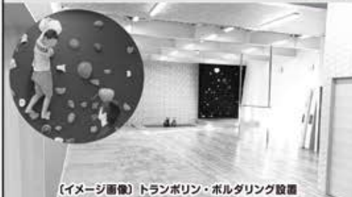
(イメージ画像) トランポリン・ホルダリング設置

「ケガの治療促進」「疲労回復、免疫力向上」などの効果が期待できます! お友達と一緒にリラックスタイム!