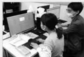
先生1名に生徒2名までの超少人数制